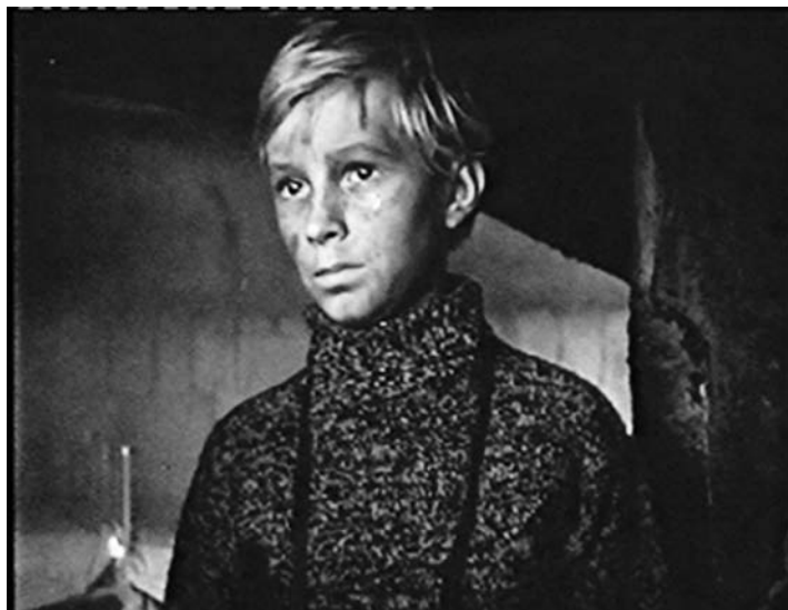
Кадр из к/ф «Иваново детство»

СТАВИТЬ КУЛЬТУРУ ВЫШЕ ПОЛИТИКИ... должен нормальный руководитель государства. Он должен понимать, что культура – это духовность, стратегическое оружие государства. Что нельзя отдавать в частные руки культуру. Нужна государственная поддержка. Как оружие