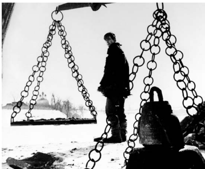
К/ф «Андрей Рублёв»

Каждый год в этот день в монастыре окропляются все постройки, все монастырские уголья и каждая комнатка в них – под пение того же тропаря. За десять лет своего существования монастырь значительно разросся, и освящение его длится не один час. По подсчетам служащих МЧС, в «Петропавловском Иордане» в 2014 году окупилось около 250 человек.