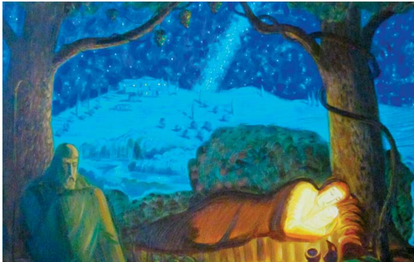
Александр Лепетухин «Бегство в Египет». Из цикла «Путь».